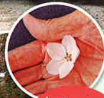
春風からのプレゼント♡