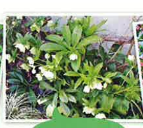
クリスマスローズ