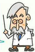
図1を見てね。総人口は減少、高齢者人口は増加していっていますよね。今後もこの状況が続くと推測され、老々介護や介護職員の人材不足など、いろんなことが心配されているね。

戦後の第1次ベビーブーム、1947年～1949年に生まれた人たちのこと。この世代の人口は他の年よりも突出して多くなっているんだよ。