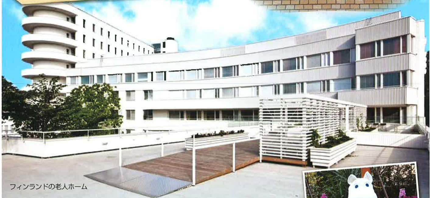
フィンランドの老人ホーム

コティコート北大阪のコティは、フィンランド語で老人ホームや家という意味のあるkotiです。