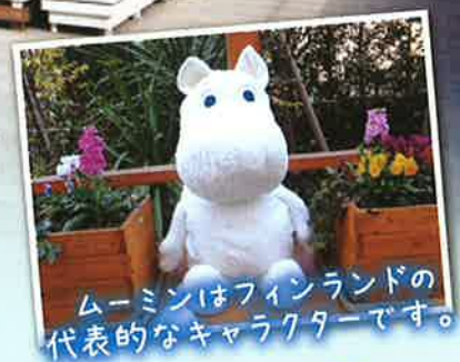
ムーミンはフィンランドの代表的なキャラクターです。