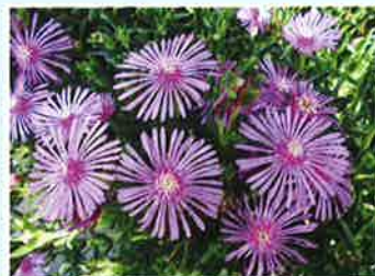
マツバギク (ツルナ科)

6月に入りコティガーデンでは鮮やかな色の花々が咲いています。暑さが増してくる季節ですがきれいな花たちを見ると心が癒されてきます。今回は3種類の花をご紹介しますと思います。