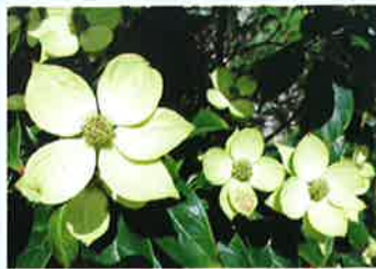
ヤマボウシ (ミズキ科)

ユリ科の花で花茎の長い物は根元から90cm位にもなり、打ち上げ花火のような咲き方をします。開花期は5月下旬～8月上旬です。