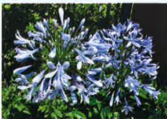
アガパンサス (ユリ科)

葉が松葉のようでキクのような花を咲かせる事から名前の由来がありますがキクの仲間ではありません。花卉が紫色でやや光沢があります。朝に花が開き、夕方に花が閉じます。春から夏にかけて長期間開花を繰り返します。