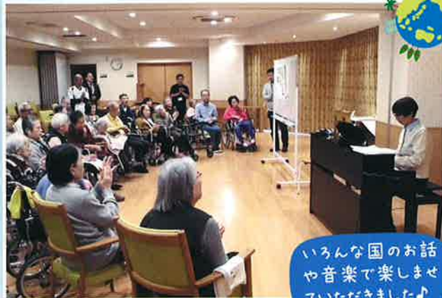
いろいろな国のお話 や音楽で楽しませ ていただきました♪