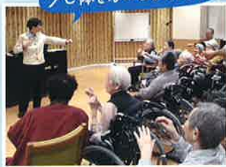
少し体をほぐしましょう!