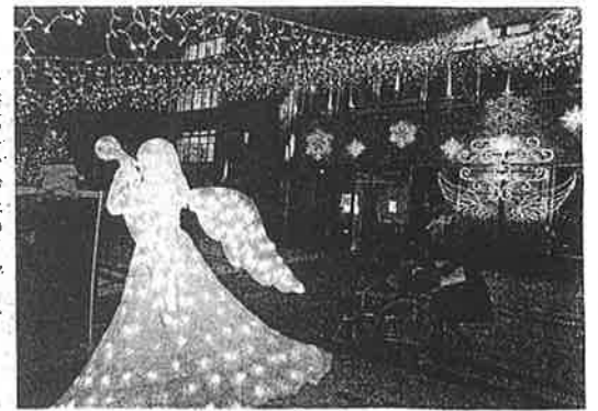
天使のオブジェのイルミネーション(大阪市淀川区で)