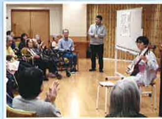
行く先々の国の衣装に早着替え!