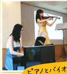
ピアノとバイオリンの優 しい音色にうっとり♪