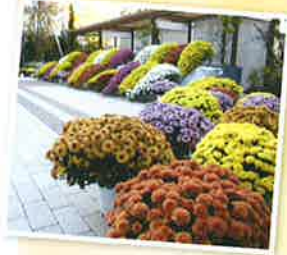
いろいろな色があって きれいやなー